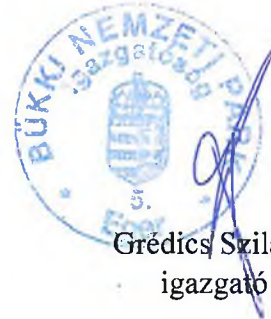
Grédics Szilárd igazgató